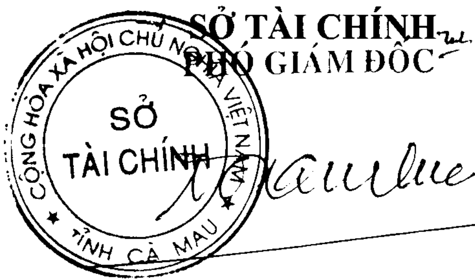
Tô Quang Phúc

đ) Các tổ chức, cá nhân có nhu cầu giới thiệu thông tin về các sản phẩm vật liệu xây dựng; hoặc cần giải đáp các thông tin đã được công bố xin liên hệ đến số điện thoại 07806 255 003./.