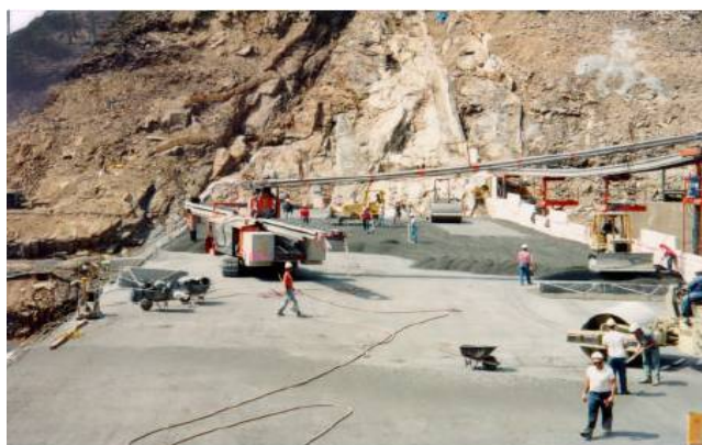
Hệ thống băng tải có máy đổ chạy bằng xích tự hành

Có thể thấy rằng các thiết bị chính cho thi công bê tông bằng công nghệ BTĐL đã có sẵn ở Việt Nam hoặc đều có thể chế tạo tại Việt Nam. Nếu phổ biến công nghệ BTĐL ở Việt Nam thì có thể tận dụng được các thiết bị có sẵn ở trong nước, không cần tốn thêm nhiều chi phí đầu tư mua thiết bị thi công mới.