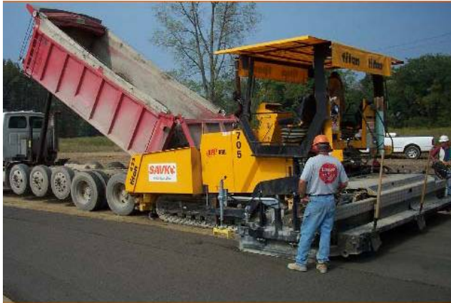
Rải hỗn hợp bê tông đầm lăn bằng máy rải