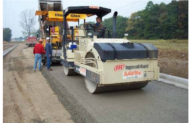
Lu lèn bê tông đầm lăn bằng lu rung