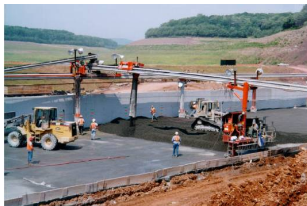
Hệ thống băng tải có ống xả di chuyển hai bên