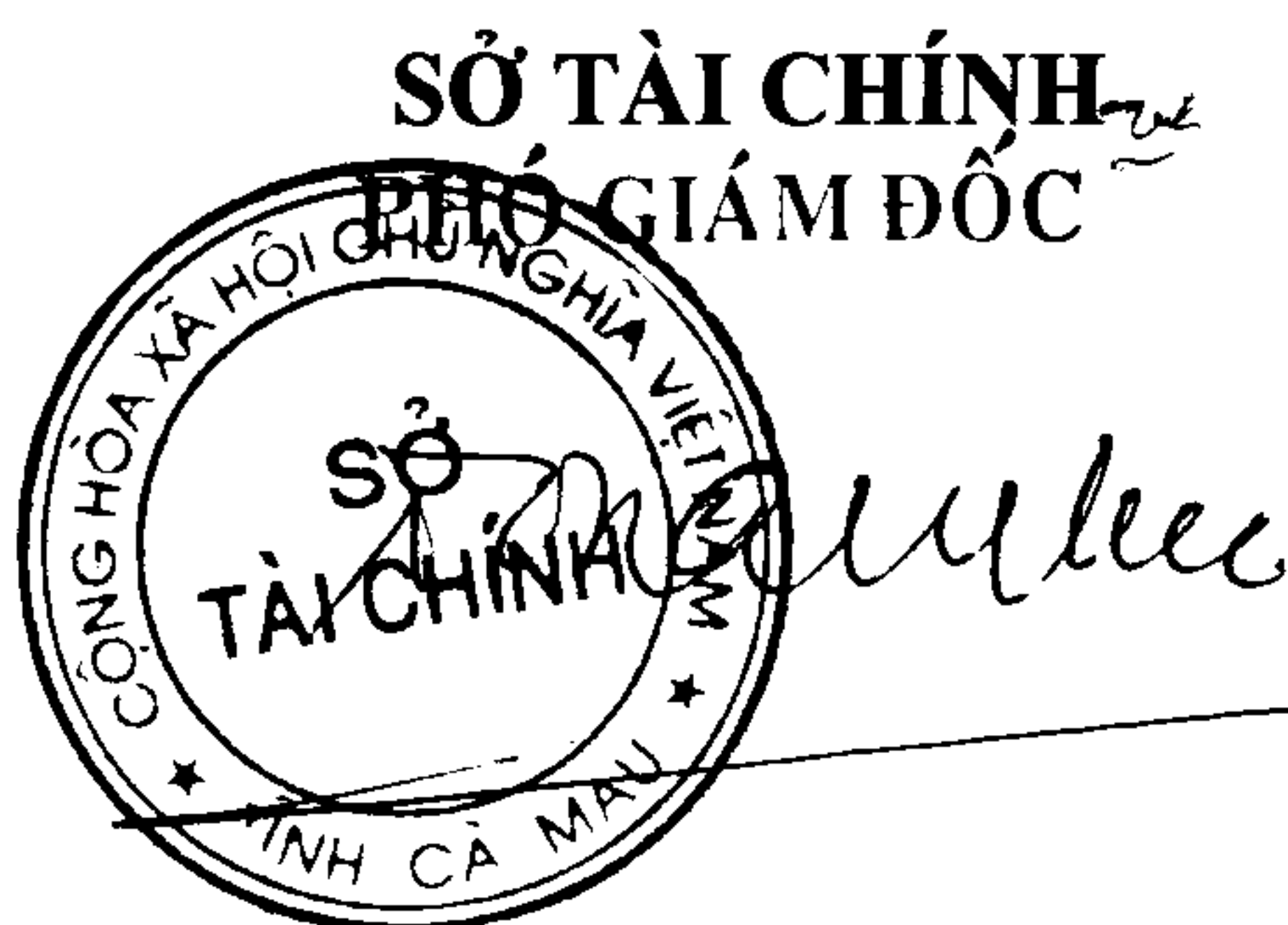
Tô Quang Phúc

đ) Các tổ chức, cá nhân có nhu cầu giới thiệu thông tin về các sản phẩm vật liệu xây dựng; hoặc cần giải đáp các thông tin đã được công bố xin liên hệ đến số điện thoại 07806 255 003./.